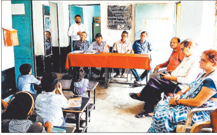
अभियान के दौरान उपस्थित शाला प्रबंधन समिति के सदस्य व स्कूल के शिक्षक।

शिक्षा गुणवत्ता के लिए लगातार प्रयास शासन स्तर पर चल रहे हैं। पांच साल बाद एक बार फिर शुरू हुआ शिक्षा गुणवत्ता अभियान शिक्षा के क्षेत्र में प्रायमरी से लेकर हाई सेकेंडरी स्कूल तक हो रहे बदलाव और शिक्षा के क्षेत्र का आंकलन कराया। इसके लिए पूर्व की तरह प्रशासनिक अधिकारियों की टीम नहीं बनाई गई है। उसकी जगह शाला प्रबंधन समिति और बच्चों के पालकों को यह जिम्मेदारी दी गई