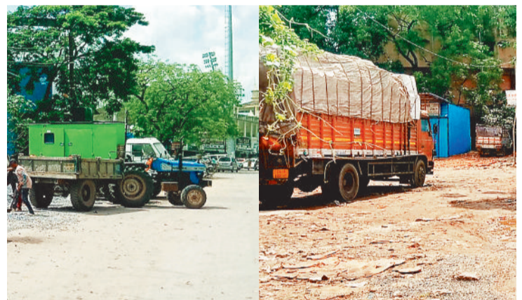
इमलीपारा रोड पर खड़े वाहन।