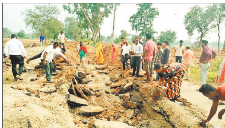
खोदे गए गड्ढे को पाटते ग्रामीण।