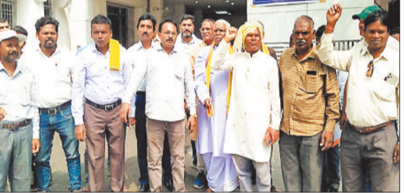
ज्ञापन देने पहुंचे सर्व आदिवासी समाज के सदस्य।

वांगचुक देश के जाने-माने पर्यावरण कार्यकर्ता हैं, जो लद्दाख क्षेत्र में जलवायु संतुलन, हिमालयी परिस्थितिकी और स्थानीय लोगों के अधिकारों के लिए लगातार संघर्ष कर रहे हैं। समाज के प्रतिनिधियों ने