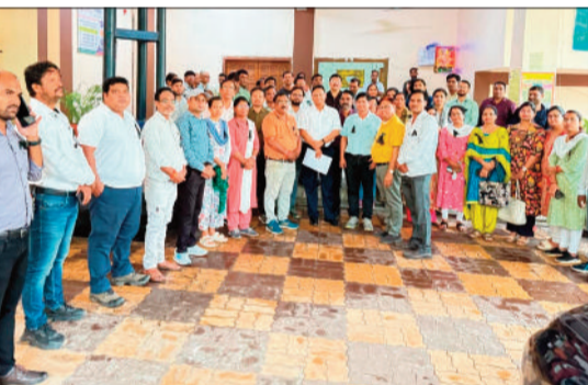
विरोध प्रदर्शन करते बिजली कर्मचारी।