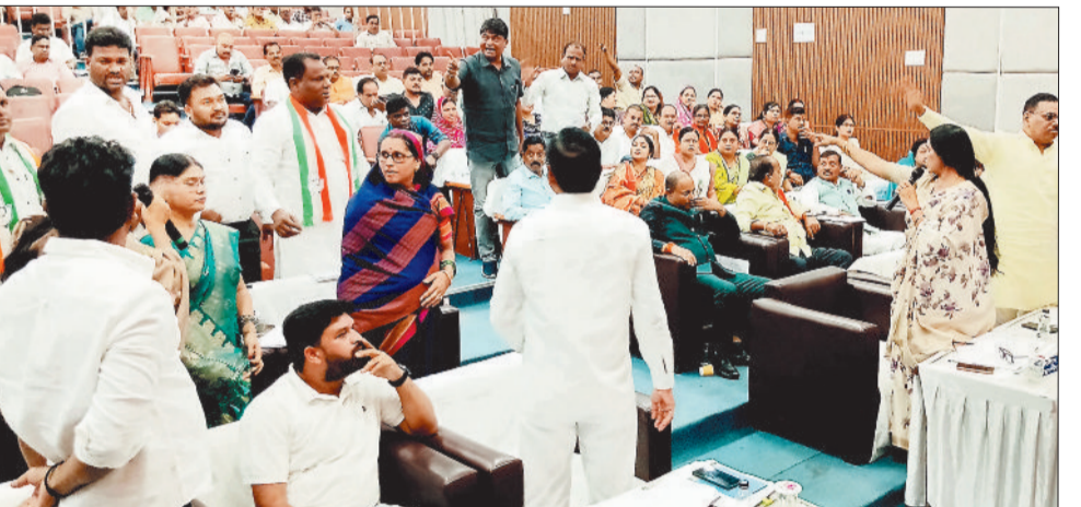
देवकीनंदन दीक्षितसभा भवन में आयोजित सामान्य सभा में हंगामा मचाते पार्षद।

ने स्मार्ट सिटी परियोजना के स्कूल में चोरी मामले में बवाल किया। उन्होंने इस्तीफा देने की चेतावनी भी दी डाली। नगर निगम की सामान्य सभा सोमवार 6 अक्टूबर को देवकीनंदन दीक्षित सभागृह में हुई। छह महीने के अंतराल के बाद हुई इस बैठक में हंगामा ही होता रहा हालांकि सत्ता पक्ष ने बहुमत के आधार पर सभी प्रस्ताव पास करा लिया। विपक्ष ने शहर की खराब सड़कों, सफाई व्यवस्था और विकास कार्यों की धीमी गति के मुद्दों पर सत्ता पक्ष को घेरा। बैठक में पार्षद निधि को वार्षिक 6 लाख रूपए से बढ़ाकर 12 लाख रूपए करने का प्रस्ताव रखा गया तो नेता प्रतिपक्ष ने 25 लाख करने की मांग कर डाली। सत्ता पक्ष का समर्थन भी मिला।