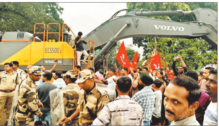
प्रबंधन की कार्यवाही को रोकते ग्रामीण और उपस्थित पुलिस बल।