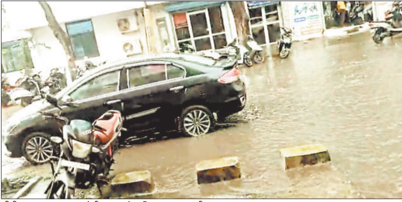
टीपी नगर लालपुरम कालोनी सड़क में बारिश का भरा पानी।