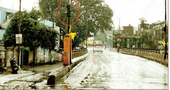
लाल धेरे में ओवरब्रिज में लगा सिग्नल।