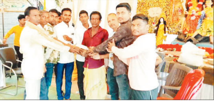
प्रतियोगियों को पुरस्कृत करते समिति के सदस्य।