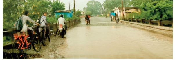
रुमगरा दर्रा मार्ग के पुल में भरा पानी।