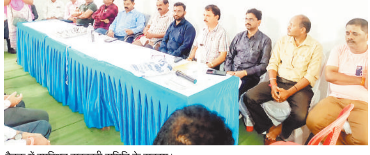
बैठक में उपस्थित सहकारी समिति के सदस्य।