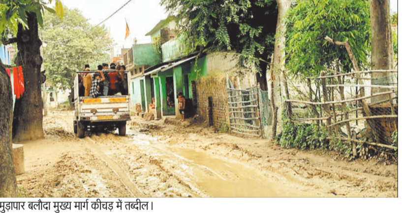
मुड़ापार बलोदा मुख्य मार्ग कीचड़ में तब्दील।

विकासखंड पाली अंतर्गत ग्राम पंचायत मुड़ापार बलोदा मुख्य से कोरबी तक 5 किमी कीचड़ से सराबोर है। जात हो की बरसात लगने से पूर्व ठेकेदार के द्वारा सड़क निर्माण के समय मुरुम के जगह मिट्टी डाल दी अब होना क्या था। बरसात शुरू हुई फिर सड़क पर फिसलन, स्कूली छात्र छात्राएं, यात्री बसें, बाईक, कार यहां तक पैदल चलना मुश्किल हो